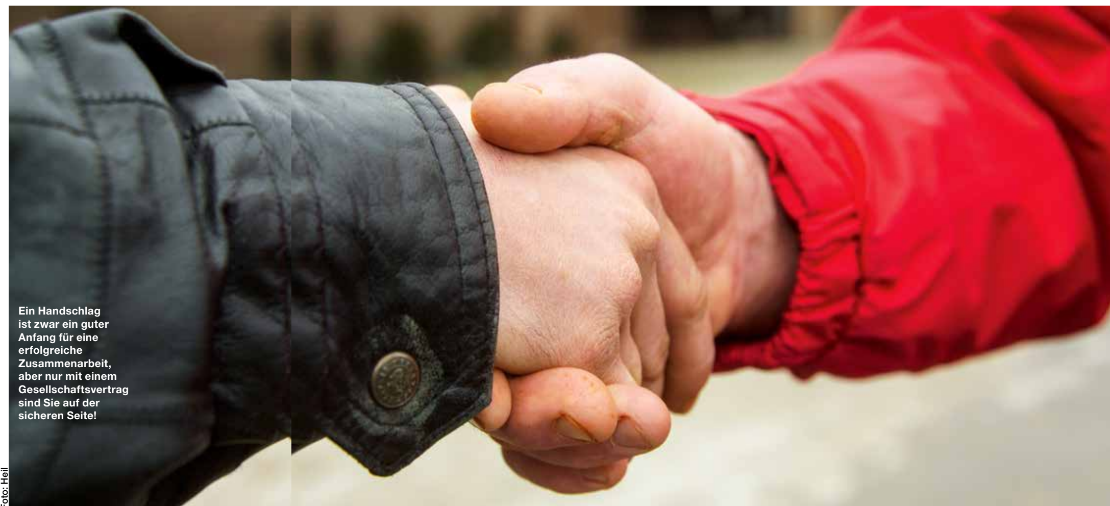
Ein Handschlag ist zwar ein guter Anfang für eine erfolgreiche Zusammenarbeit, aber nur mit einem Gesellschaftsvertrag sind Sie auf der sicheren Seite!

Vereinbaren Sie am besten eine Festlaufzeit, in welcher der Gesellschaftsvertrag nicht durch ordentliche Kündigung beendet werden kann. Die Dauer